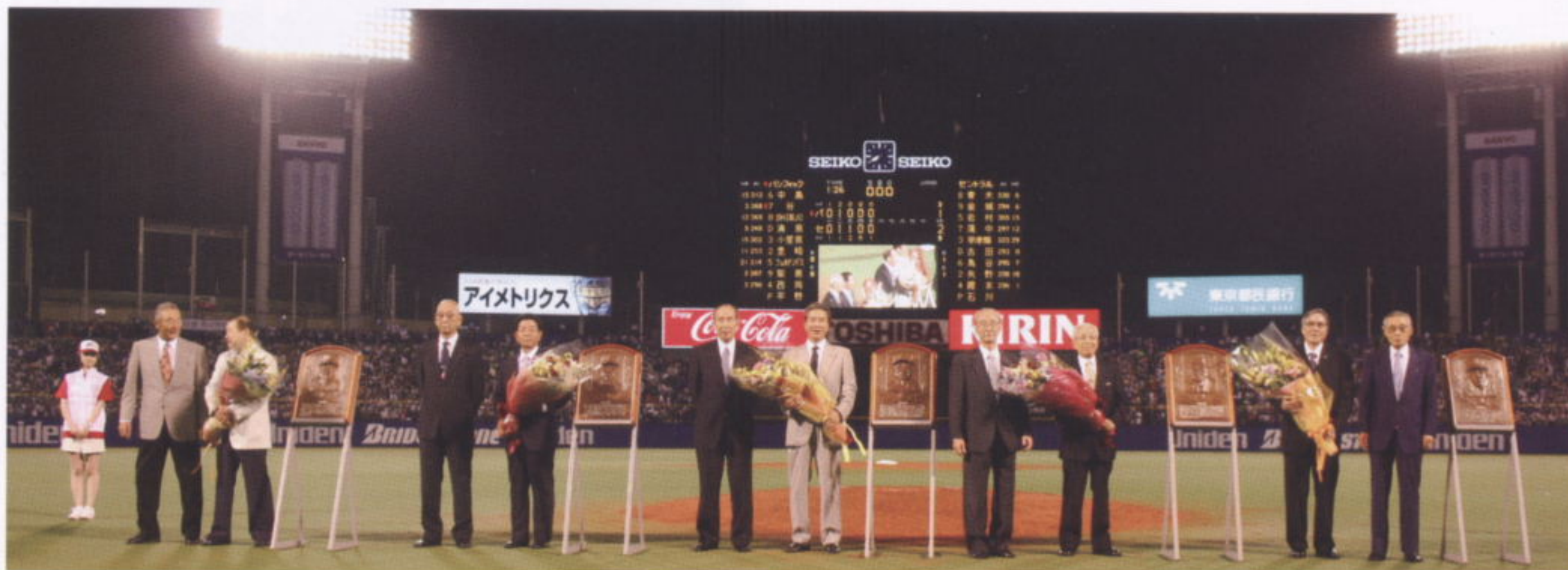
プレゼンターと記念撮影

試合前に行った厳粛なレプリカ贈呈の儀式と5回終了後に行った温かい雰囲気の花束贈呈とのコントラストが、新しい形として興味深い表彰式でありました。